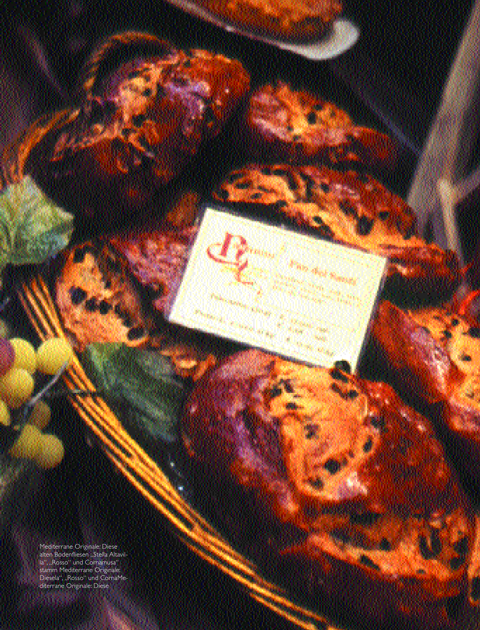
Mediterrane Originale: Diese alten Bodenfliesen „Stella Altavilla“, „Rosso“ und Cornamusa“ stamm Mediterrane Originale: Diesela“, „Rosso“ und CornaMe- diterrane Originale: Diese