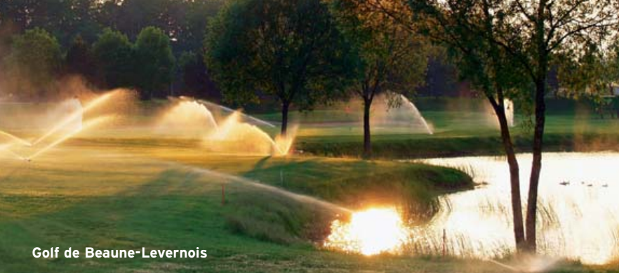
Golf de Beaune-Levernois

Bei den Rotweinen sind die Qualitäts- und Preisstufen noch ausgeprägter als bei den Weißweinen. Im Burgund kommt eine Besonderheit dazu, die gerade beim Bestellen oder Kaufen von Wein viel Erfahrung und Wissen voraussetzt: Die besten Lagen gehören meistens sehr vielen Besitzern. Eine Folge des französischen Erbrechts, das gerade sehr gute Parzellen wie zum Beispiel „Clos de Vougeot“ wider alle Vernunft so oft aufteilte, bis sie nicht mehr vernünftig zu bewirtschaften waren und der Rebberg über 100 Besitzer hatte. Alle dürfen auf das Etikett ihres Weines den magischen Namen schreiben, aber nur wenige machen auch einen exzellenten Wein. Nur der berühmte Weinberg „Clos de Tart“ in Morey-Saint-Denis kann sich rühmen, seit der Anpflanzung in 1142 im Besitz von nur drei Familien zu sein.