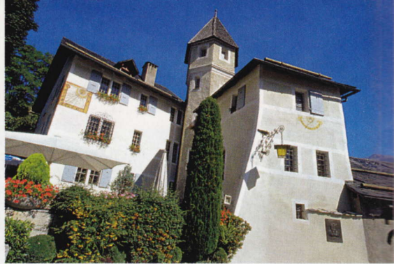
Das barocke Château de Villa in Sierre ist Ziel eines schönen Weinwanderwegs

Auch für nicht berggängige Wanderer gut zu bewältigen ist der Weinlehrpfad von Salgesch nach Sierre: Sie starten im Reb- und Weinmuseum und erreichen nach etwa zwei Stunden das Château de Villa, einen barocken Bau hoch über Sierre, mit einer imposanten Önothek, Restaurant, schönem Garten sowie einem regelmäßigen Postauto, das müde Wanderer bequem zu Tal bringt. CHRISTIAN WENGER