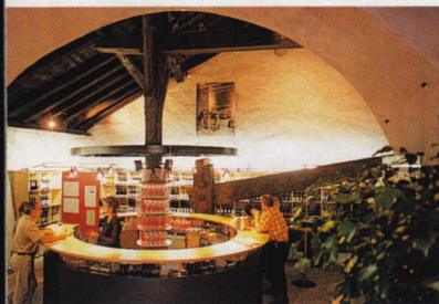
Verkosten, genießen, kaufen: Önothek im Château de Villa in Sierre

Office de Promotion des Produits de l'Agriculture valaisanne, Sion, Tel. 0041-27-322 22 47; Fax 322 87 89.