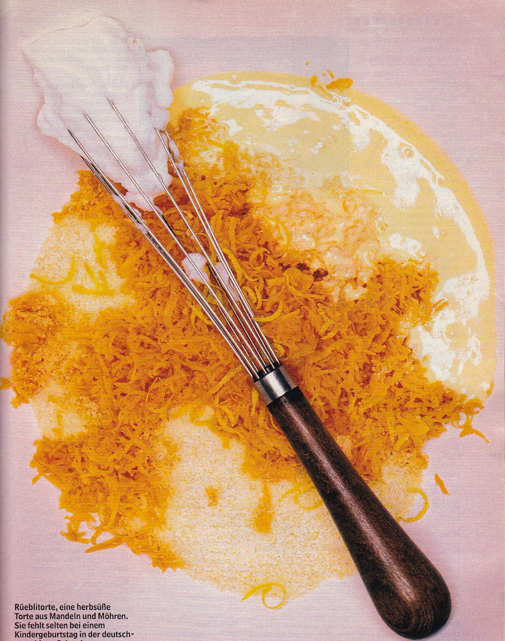
Rüeblitorte, eine herbsüße Torte aus Mandeln und Möhren. Sie fehlt selten bei einem Kindergeburtstag in der deutschsprachigen Schweiz