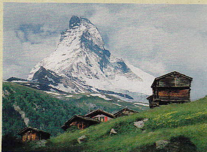
Schweizer Wahrzeichen: das 4478 Meter hohe Matterhorn

4 Bei nicht zu großer Hitze braun und knusprig werden lassen (das dauert etwa 20 Minuten). Salzen und pfeffern (zwei Drehungen aus der Pfeffer-